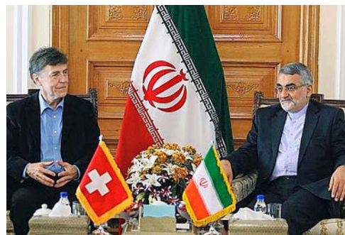
Luzi Stamm (à g.) à Téhéran avec le président de la commission de politique étrangère du parlement iranien, Allaedin Boroujerdi.

En Suisse, l'épisode a fait couler beaucoup d'encre pendant une semaine. Et pourtant, malgré l'avalanche de critiques émanant de nombreux médias et politiciens, les choses en resteront là. Comme du reste des épisodes similaires observés dans le passé.