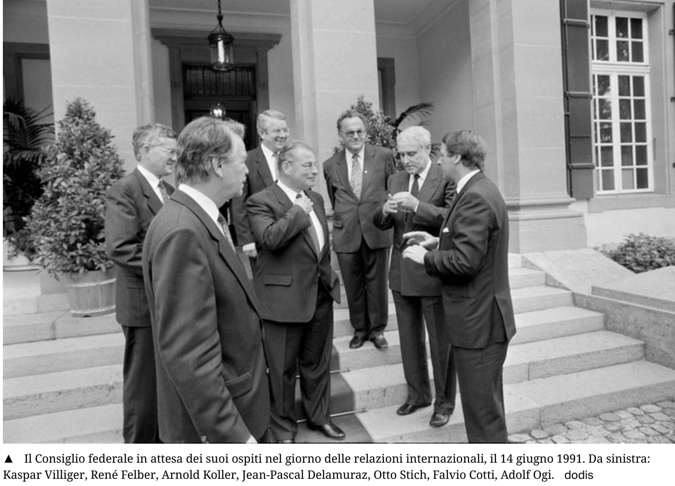
▲ Il Consiglio federale in attesa dei suoi ospiti nel giorno delle relazioni internazionali, il 14 giugno 1991. Da sinistra: Kaspar Villiger, René Felber, Arnold Koller, Jean-Pascal Delamuraz, Otto Stich, Falvio Cotti, Adolf Ogi.

Nel 1991, la Svizzera festeggia il 700° anniversario della Confederazione. Ma il richiamo alle sue origini mitiche, mentre sono in corso i negoziati sullo Spazio economico europeo, non basta a occultare il disorientamento di fronte al processo di integrazione europea.